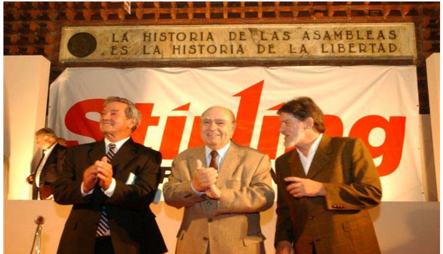
Stirling, Sanguinetti y Hierro reciben el aplauso del público al comenzar el acto

Tras recibir un gran aplauso al fin de sus palabras, Stirling, en mangas de camisa, salió de la Sala de la Convención rodeado de militantes foristas que se apretujaban para saludarle.