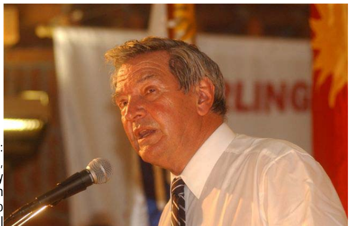
Habla Stirling: humildad, concordia y preocupación por lo social