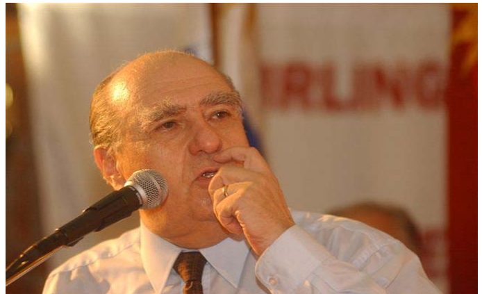
Hierro subrayó la responsabilidad que recayó en el candidato y fustigó actitudes ajenas.